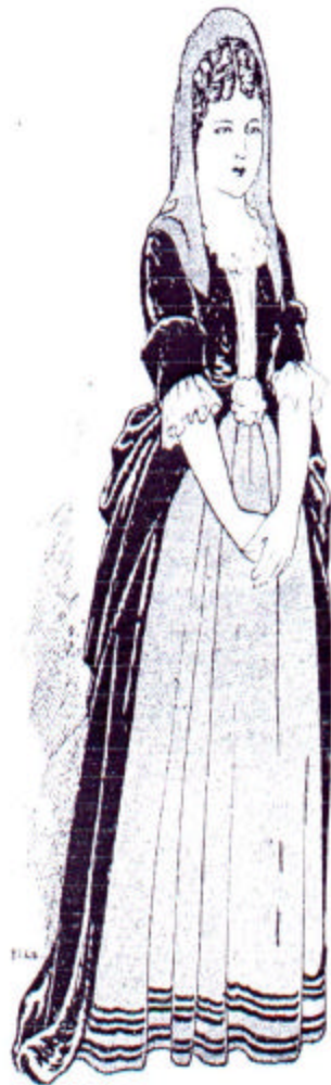
«Uma réplica de setas, um saio de mal- cochado preto e gata com posturinas.» (do. e text.)