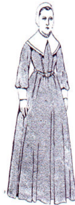
«Uma touca de colante e um manteo de lã.» (do. e text.)