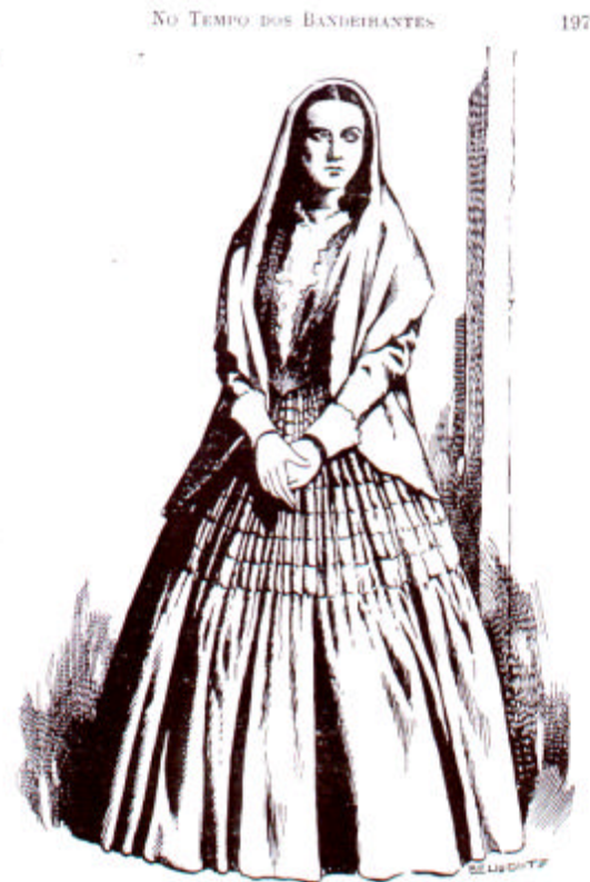
Mulher de -manto de tafetá, roupetilha e vasquinha